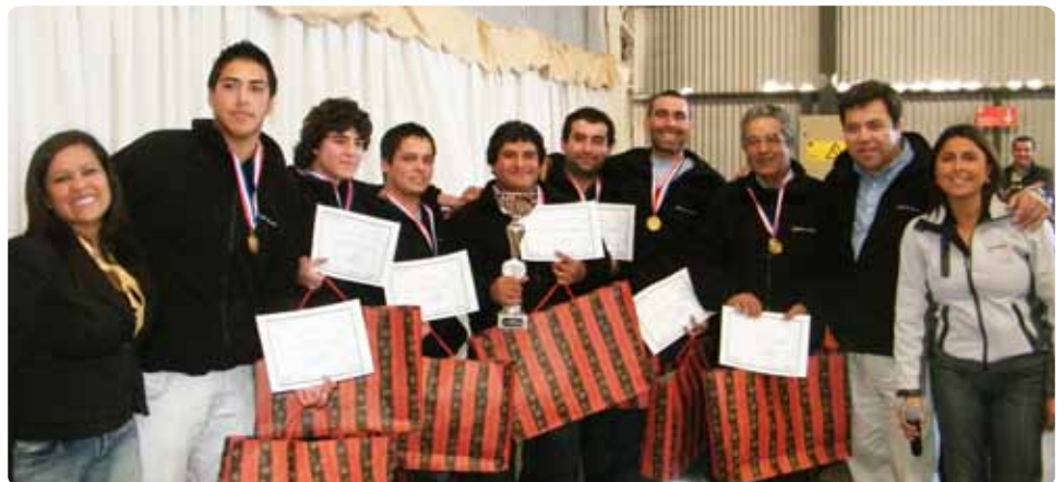
El equipo ganador “Vamo’ a portarnos mal”.