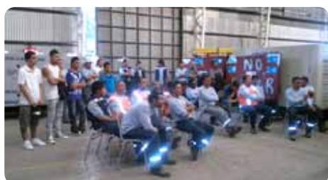
Trabajadores en plena capacitación.

Ya no es requisito para entrar a determinada empresa sólo un título universitario y un postgrado, sino también que el trabajador esté constantemente capacitándose para que tenga un eficaz rendimiento laboral.