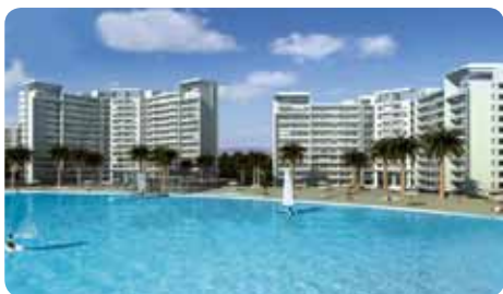
Departamentos en Laguna del Mar.

La empresa de urbanización eléctrica estará a cargo de las obras eléctricas del complejo inmobiliario Aconcagua en La Serena. Se trata de un proyecto exclusivo que contará con edificios de gran calidad, laguna artificial y piscinas con playas.