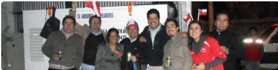
¡Todos juntos apoyando a nuestra selección!