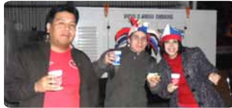
Preparados para celebrar.