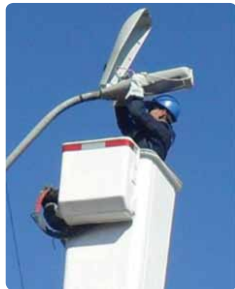
Realizando labores de recambio de luminarias.

A futuro, están a la espera de que nuevas comunas presenten sus proyectos de alumbrado público. ■