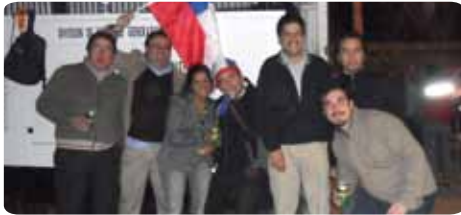
Alentando a la Roja.

La empresa no estuvo ajena a la Copa América; Campeonato Sudamericano de Fútbol más importante de nuestro continente. Con banderas, gorros y el infaltable asado, nuestros trabajadores y ejecutivos apoyaron a la roja a todo pulmón. ■