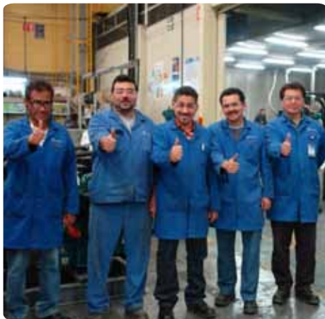
Trabajadores de Ottomotores.

La multinacional mexicana, dedicada a la fabricación de plantas de generación y con más de 60 años de trayectoria se posicionará en nuestro país mediante la compañía Sinelec, perteneciente al Grupo de Empresas Sinec.