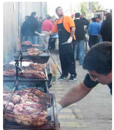
¡Un rico asado para celebrar!

También se aprovechó de premiar a los ganadores del Campeonato de Fútbol, siendo los vencedores el equipo “Vamo’ a portarnos mal”.