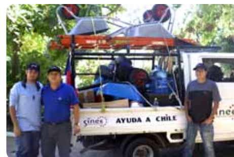
Nuestro camión listo para ir en ayuda.

La RSE es vista por las compañías líderes como algo más que un conjunto de prácticas puntuales, iniciativas ocasionales o motivadas por el marketing, las relaciones públicas u otros beneficios empresariales. ■