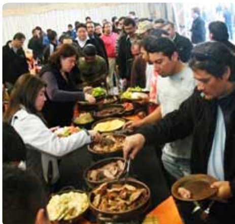
Buffet de ensaladas y acompañamientos.